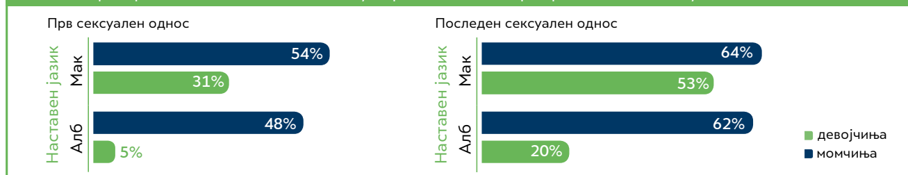
Табела 3: Пропорции на 15-годишни млади со употреба на кондом при прв и последен сексуален однос

Со пораст на сексуалните искуства, се зголемува и употребата на кондоми кај младите во Македонија, а со тоа се подобрува и нивната заштита од несакана бременост и сексуално преносливи болести. Оваа тенденција е видлива кај обата рода, од двете етнички заедници. Сепак, девојчињата значително поретко од момчињата умеат да се заштитат и при првиот и при последниот сексуален однос. Особено е висока меѓуродовата диспропорција при првиот сексуален однос, и меѓу етничките Албанци, и до 9:1, во соодносот момчиња и девојчиња.